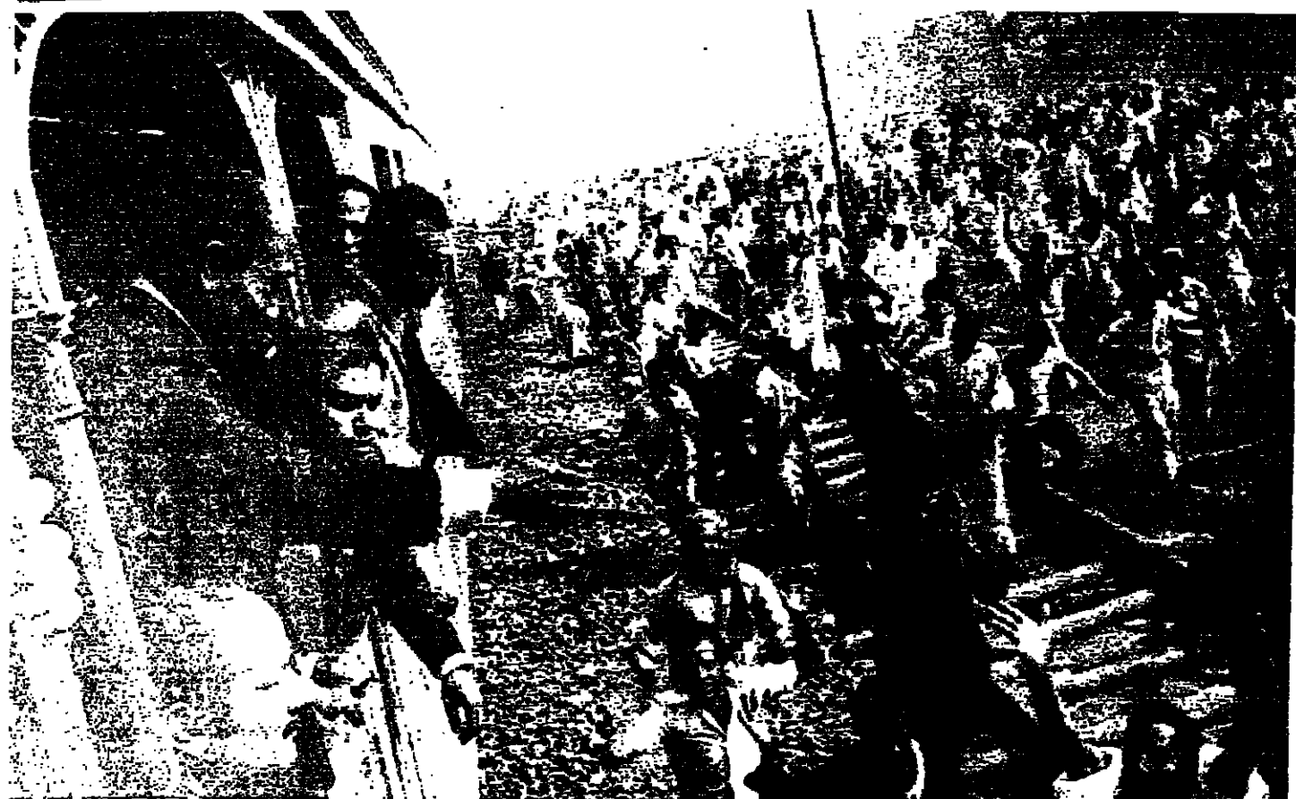
الرئيس السادات يحيى المواطنين في محطات السكة الحديدية بين اسبوط والجزيرة لدى عودته الى القاهرة بعد حضوره احتفالات اول ايار في اسبوط

الاعداد للقاء قسي الشمس وأوضحت الصحيفة انه في إطار الإعداد لهذا اللقاء الهام بين الرئيسين السادات وفورد ، جرت الاتصالات بين الصحفيين من مصر وسوريا ، والصحفيين الأمريكيين والمصريين في القاهرة ، وان التعليمات قد صدرت الى الصحفيين من سوريا بالسفر الى فيينا يوم ١٨ ايار الحالي لكي تتاح له فرصة تقديم أوراق اعتماده للمشاركة في الترتيبات النهائية لهذا اللقاء .